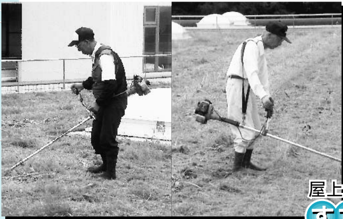
屋上の草刈り すずらん