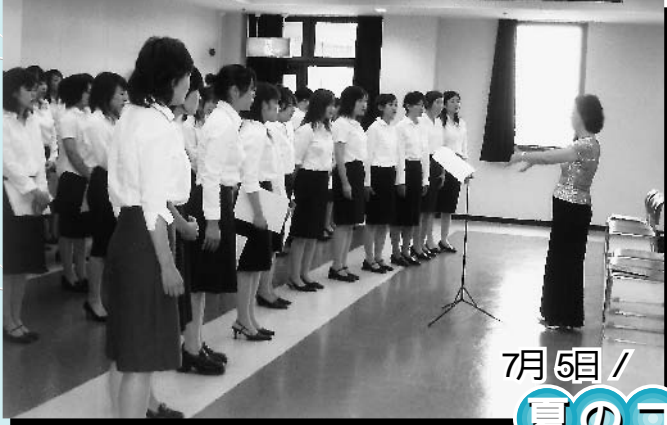
7月5日 / 夏のコンサート