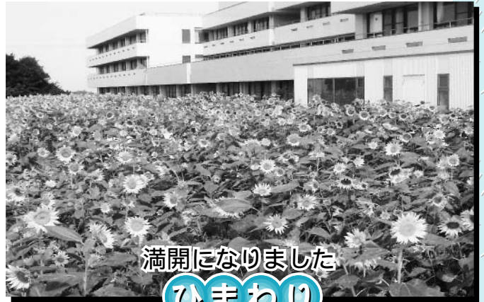
満開になりました ひまわり