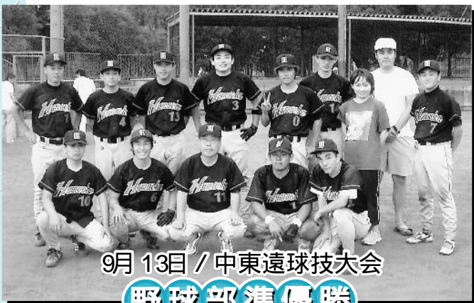
9月13日 / 中東遠球技大会 野球部準優勝