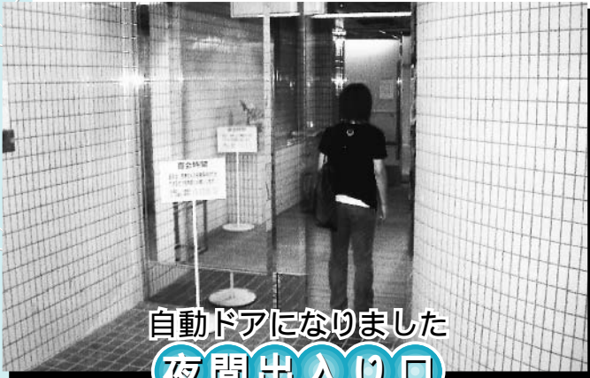
自動ドアになりました 夜間出入口