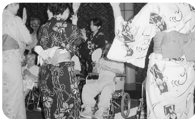
7月29日(金) 総合保健福祉センター夏祭り