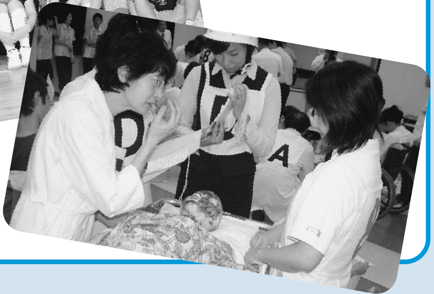
9月14日(水) 病院トリアージ訓練