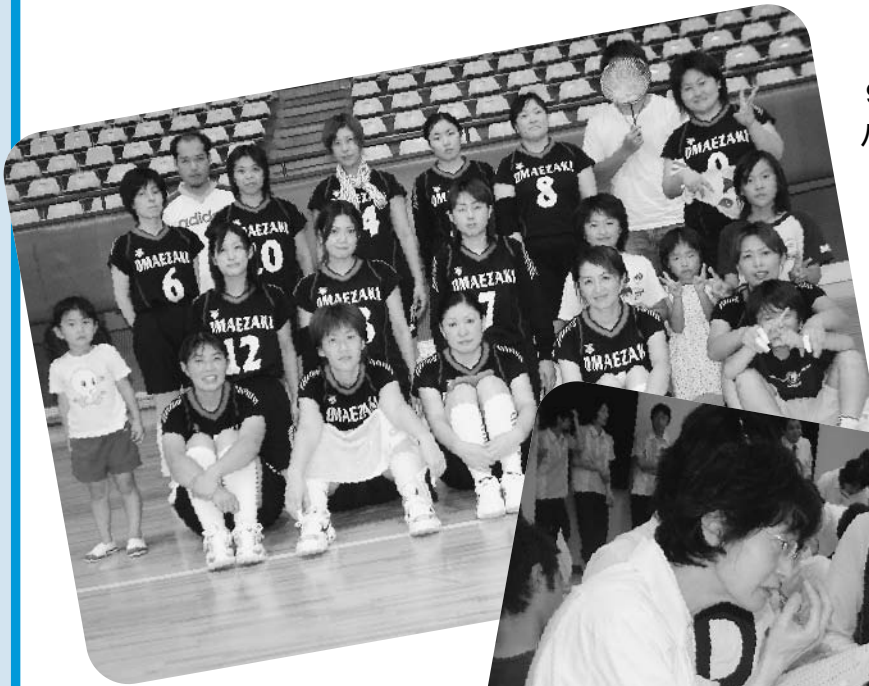
9月3日(土) バレー部 4年連続県大会第3位