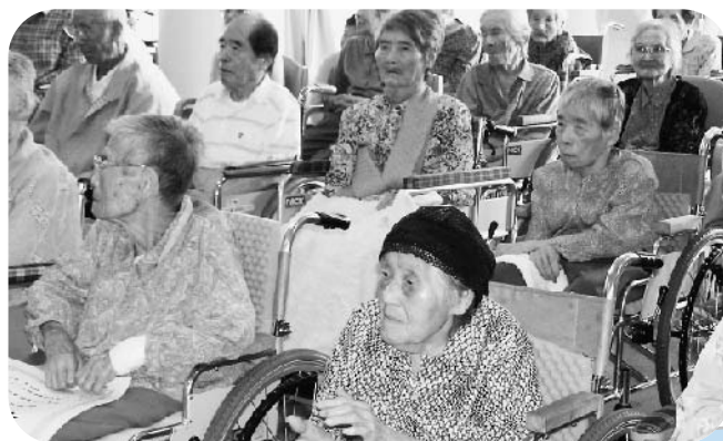
9月14日(水) 総合保健福祉センター敬老会