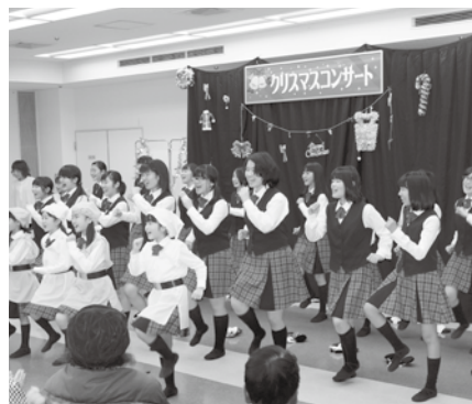
12/27 クリスマスコンサート 出演：御前崎市少年少女合唱団