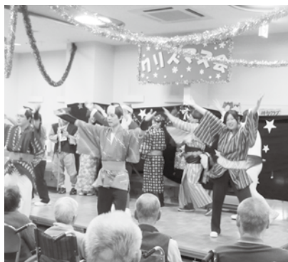
12/15 総合保健福祉センター クリスマス会