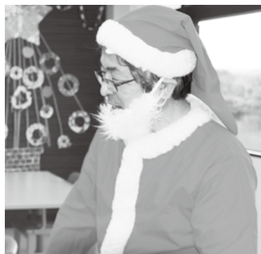
12/20 院長サンタの病棟訪問