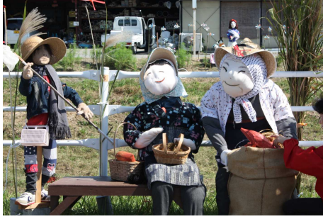
御前崎市新野 案山子祭り