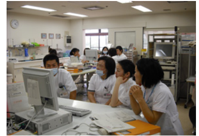
合同カンファレンス

夜間も看護師がお部屋に訪問いたしますので、ご安心下さい。 ナースコールでの会話は他の患者様の迷惑になりますので、直接お部屋にお伺いいたします。