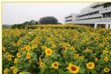
市立御前崎総合病院 2階花畑