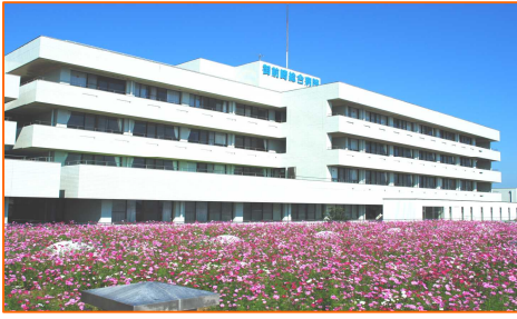
市立御前崎総合病院コスモス畑