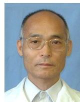
佐倉 東武 婦人科