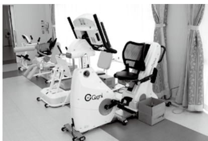
家庭医療センターリハビリ機器