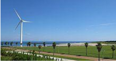
マリナーパーク御前崎