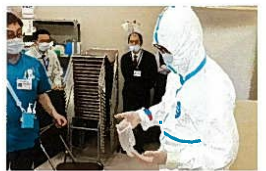
2月 原子力防災設営訓練