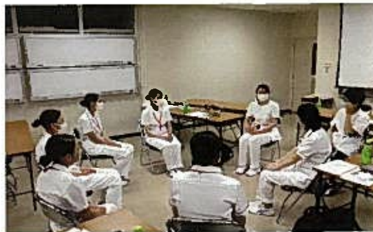
10月 高校生ナース体験