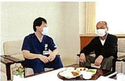
2月 御前崎市農業振興会から食材提供