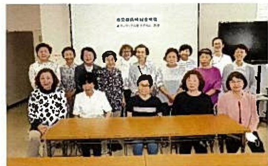
6月 病院ボランティア「すずらん」第21回総会