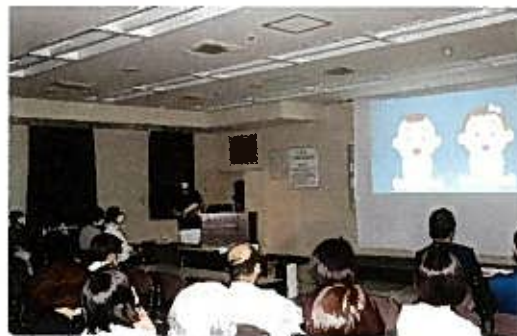
2月 院内学術発表会