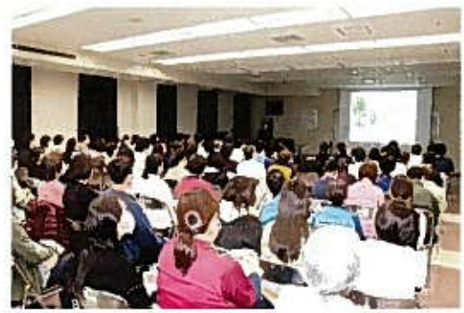
12月 感染管理研修会