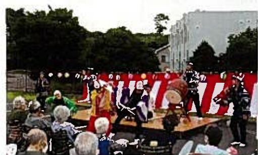
7月 総合保健福祉センター夏祭り