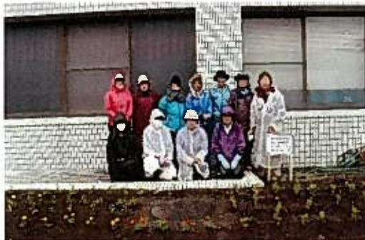
6月 御前崎市花の会による植栽（正面玄関花壇）