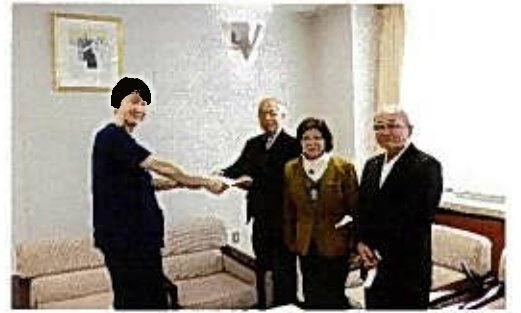
2月 御前崎市地域医療を育む会から感謝状