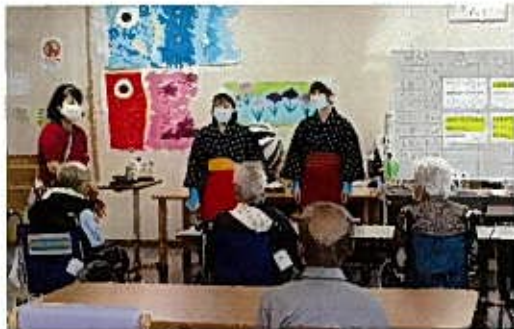
5月 総合保健福祉センター新茶会