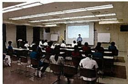
7月 交通安全講習会