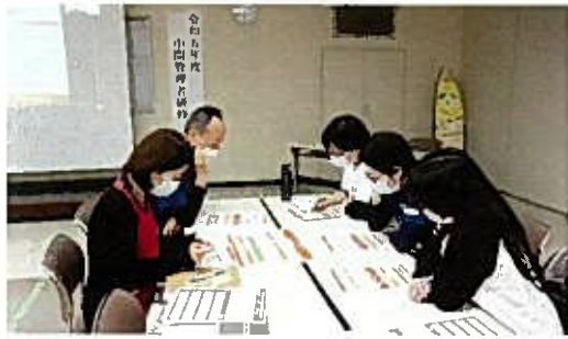
1月 中間管理職研修