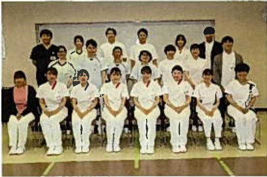
4月 辞令交付式・新入職員対面式