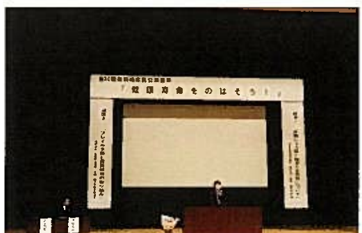
3月 第30回市民公開講座