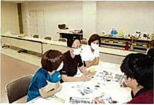
10月 ワールドカフェ (質向上委員会)